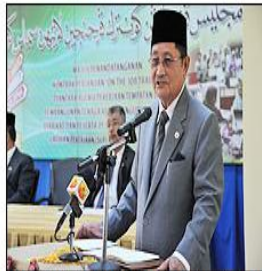
Minister of Home Affairs speaks at the event.